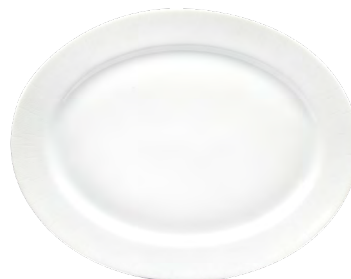
Plat ovale* Oval dish L : 40 cm - L: 15.7" l : 31,5 cm - W: 12.4" Ref. 31935 501 0042