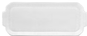
Plat à cake* Oblong cake platter L : 39 cm - L: 15.4" l : 15,5 cm - W: 6.1" Ref. 31935 549 0073