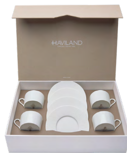
Coffret de 4 tasses & soucoupes thé* Set of 4 teacups & saucers Ref. 31935 393 2636