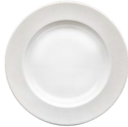
Plat rond creux* Deep platter Ø : 31,5 cm - Ø: 12.4" Ø : 21,5 cm (int.) - Ø: 8.5" (int.) 55 cl - 14.2 oz Ref. 31935 528 0035