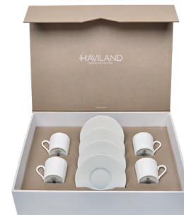
Coffret de 4 tasses & soucoupes café* Set of 4 coffee cups & saucers Ref. 31935 393 2637