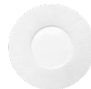
Assiette à pain Bread & butter plate Ø : 16 cm - Ø: 6.3" Ø : 8,4 cm (int.) - Ø: 3.3" (int.) Ref. 31935 393 0010