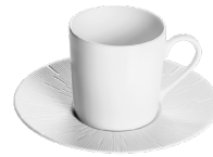
Tasse & soucoupe café Coffee cup & saucer

Théière en coffret Teapot set Ref. 31935 393 2667