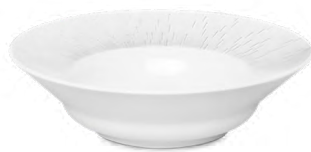
Coupe saveur* Large bowl Ø : 20,5 cm - Ø: 8.1" H : 7 cm - H: 2.8" 24 cl - 8.1 oz Ref. 31935 393 0122