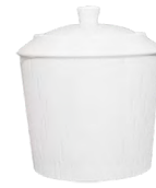
Sucrier Sugar box

H : 9,5 cm - H: 3.7" 15 cl - 5.1 oz Ref. 31935 393 0431