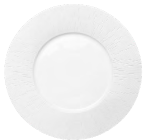
Assiette de présentation Underplate Ø : 32 cm - Ø: 12.6" Ø : 18,5 cm (int.) - Ø: 7.3" (int.) Ref. 31935 393 0029