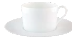
Tasse & soucoupe thé Teacup & saucer

Ø : 13 cm - Ø: 5.1" H : 6 cm - H: 2.4" 7,5 cl - 2.5 oz Ref. 31935 393 2231