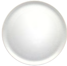
Plat à tarte* Tart platter Ø : 31,5 cm - Ø: 12.4" Ø : 26,5 cm (int.) - Ø: 10.4" (int.) Ref. 31935 511 0071

Contemporaine Contemporary – Blanc White 31935 – Gris clair Light grey 31351 – Gris anthracite Dark grey 31350