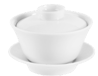
Tasse & soucoupe thé chinoise* Chinese teacup & saucer Ø : 10,5 cm - Ø: 4.1" H : 5,5 cm - H: 2.2" 13 cl - 4.4 oz Ref. 31935 450 0345