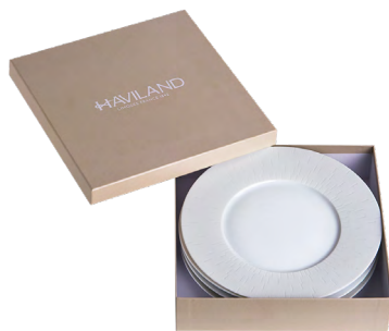
Coffret de 4 assiettes à dessert* Set of 4 dessert plates Ref. 31935 393 2601

Ø : 16 cm - Ø: 6.3" H : 5,5 cm - H: 2.2" 14 cl - 4.7 oz Ref. 31935 393 2234