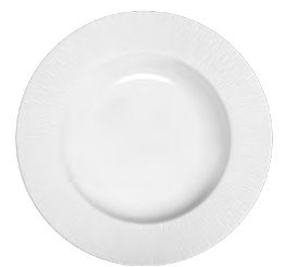
Assiette creuse à aile Rim soup plate Ø : 23,5 cm - Ø: 9.3" Ø : 15,5 cm (int.) - 6.1" (int.) 17 cl - 5.7 oz Ref. 31935 393 0005