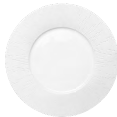
Assiette à dessert Dessert plate Ø : 24,5 cm - Ø: 9.6" Ø : 14,4 cm (int.) - Ø: 5.7" (int.) Ref. 31935 393 0007