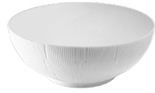
Bol à céréales Cereal bowl

Contemporaine Contemporary – Blanc White 31935 – Gris clair Light grey 31351 – Gris anthracite Dark grey 31350