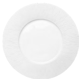
Assiette gastronomie Large dinner plate Ø : 29,5 cm - Ø: 11.6" Ø : 17,5 cm (int.) - Ø: 6.9" (int.) Ref. 31935 393 0022