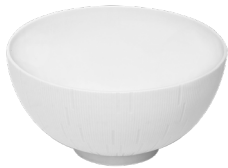
Saladier* Salad bowl Ø : 20,5 cm - 8.1" H : 10,5 cm - 4.1" Ref. 31935 393 0053