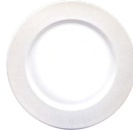
Plat rond plat* Flat dish Ø : 31,5 cm - Ø: 12.4" Ø : 21,5 cm (int.) - Ø: 8.5" (int.) Ref. 31935 528 0031