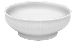
Saladier* Salad bowl Ø : 27,5 cm - Ø: 10.8" H : 11 cm - H: 4.3" 290 cl - 98.1 oz Ref. 31935 501 0053